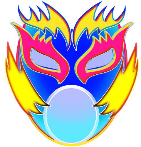
Técnica: Ilustración digital Medidas: 4745 x 4725 px Año: 2021 Precio: $4.500 MXN

Al tener experiencia en Artes Visuales, Arquitectura y Diseño, ha aprendido a explorar diferentes medios, técnicas y formatos sin dejar ni una a un lado como del video a la pintura, lo sonoro, la fotografía o instalación y la gráfica está claro que para él la construcción se ha convertido en una forma de crear un sucesión de imágenes similares dándole una continuidad y través de esta exploración visual busca trasladar cuestiones expresivas, como la densidad o armonía del color, texturas, patrones, trazados y medidas donde las organiza de una manera específica con una composición precisa en obra a presentar, su interés visual ha girado en torno al concepto del amor o la muerte a través del arte para comprender y apreciar la vida tanto como a nivel personal como en general y la búsqueda de la trascendencia del ser humano por medio de la espiritualidad de nuestro ser.